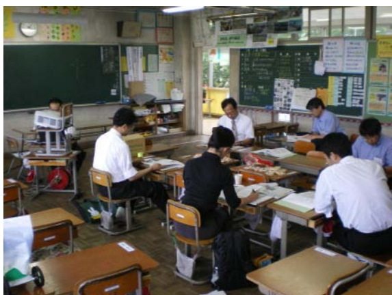
< 中3 3力のつりあい >