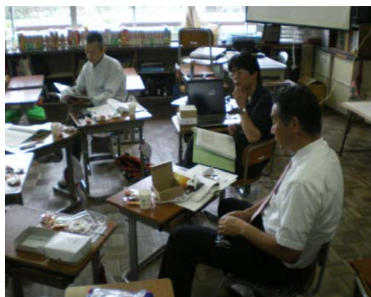
< 小6 電気の利用 >