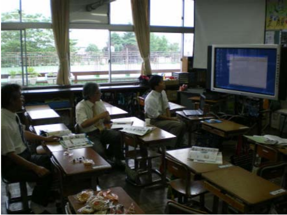
< 小3 風のはたらき >