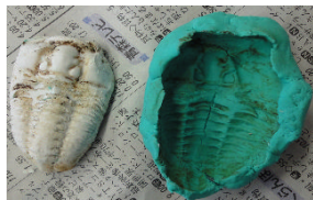
写真は三葉虫の例

粘土で化石の型を取り、石膏を流し込み、固める。石膏に砂を混ぜるとよりリアルになる。