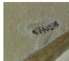
三途川層の 昆虫化石 (押切先生蔵)

いこいの村の近くにある三途川層の路頭が道路工事のためにコンクリートで固められてしまっていたので、工事の時にけずらした土砂を置いた場所での採集となった。路頭を掘るより、簡単に層状の石を入手できた。昆虫の化石はその場で発見できなかったが、木の葉の化石は多数入手できた。